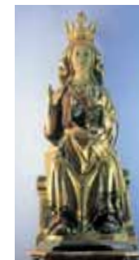
Santuario y Virgen de Ibernalo. (Santa Cruz de Campezo)

El edificio actual, del siglo XVI, tiene un bonito pórtico con arcos y, franqueando la puerta, podemos admirar el elegante retablo barroco que alberga la imagen de la Virgen de