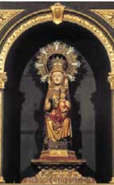
Virgen de Angosto. (Villanañe)

La Virgen de Escolumbe, del siglo XIII, se encuentra, sin embargo, en un retablo lateral de líneas barrocas. En este caso, como en otros, se trata de una imagen de María con el Niño en el regazo.