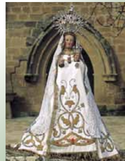
Virgen de Bercijana. (Yécora)