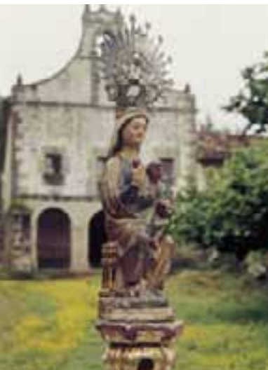
Virgen Blanca delante de su Santuario. (Llanteno)

un par de kilómetros desde el pueblo, por una pista entre pinares, para llegar al Santuario. En algún tiempo parece que estuvo dedicado a los santos Justo y Pastor.