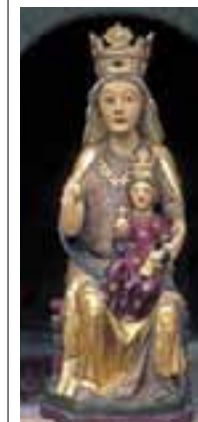
Nuestra Señora de Escolumbe y el Santuario a ella dedicado. (Catadiano)

A unos 5 Kms. de Llodio, después de ascender por una estrecha carretera con fuertes pendientes, encontramos el conjunto formado no sólo por el santuario, sino también por algunos caseríos, dos ermitas y un campanario exento. Una de las ermitas está dedicada a San Antonio y la otra, a Santa Lucía, aunque aparentemente forman un sólo edificio con el santuario. Santa Lucía da nombre al término e incluso a la romería que tiene lugar el lunes de Pentecostés y el domingo siguiente.