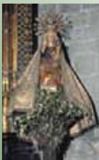
Santuario e imagen de Nuestra Señora de la Encina. (Artziniega)

La leyenda viene explicando desde hace siglos el origen del lugar: una muchacha encontró hacia el siglo XI una imagen de la Virgen en una encina, lo que motivó que allí se construyera un edificio románico.