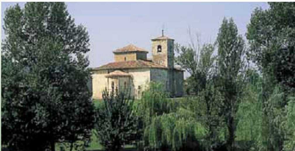
Basílica de San Prudencio. (Armentia)

Estamos ante un templo de una sola nave con crucero. A pesar de ello, la basílica responde a un modelo poco frecuente en la arquitectura románica. En su pórtico hay un importantísimo conjunto de esculturas,