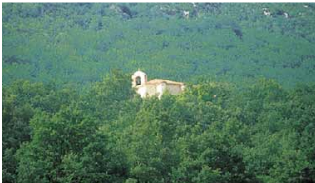
Santuario de Okon, entre el bosque, al pie de la Sierra de Toloño-Cantabria.

En Alava son muy numerosas las ermitas y verdaderamente interesantes los santuarios. En estas líneas se va a hacer una breve descripción de los más importantes, pero queda para el visitante el reto de conocerlos más a fondo y descubrir otros. Todos ellos encierran unos valores religiosos, artísticos, históricos y costumbristas dignos de ser conocidos.