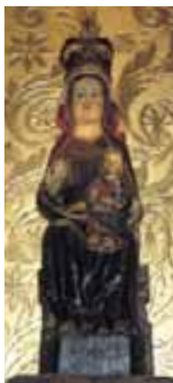
Interior del Santuario y Andra Mari de Ntra. Sra. del Yermo. (Llodio)

El santuario es gótico y está definido por bellos arcos, ventanas y vidrieras. La imagen de la titular es un interesante ejemplar del siglo XIV, del tipo Andra Mari. Santa María del Yermo aparece sentada con el Niño sobre sus rodillas. Completan la belleza del edificio las capillas del ábside y el retablo mayor, interesante ejemplar de estilo plateresco.