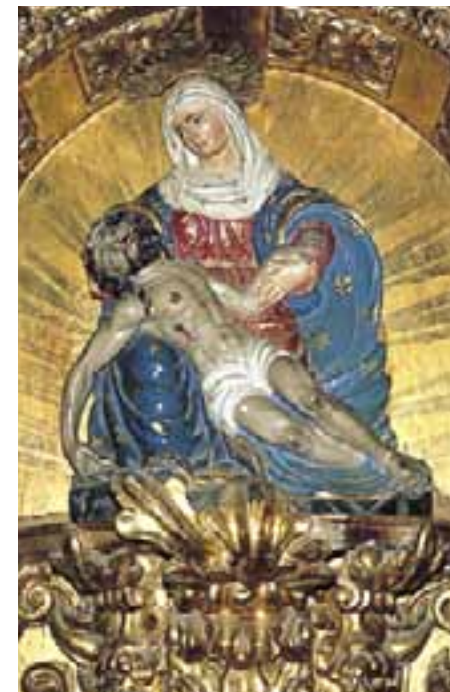
Imagen de la Virgen de Garrastatxu. (Baranbio)

Finalizamos este recorrido por los santuarios, a través de las seis comarcas alavesas, visitando Nuestra Señora de Oro en el valle de Zuia y Andra Mari de Ibabe en el Valle de Aramaio.