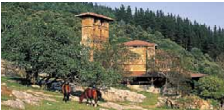
Santuario de Nuestra Señora del Yermo en lo alto del monte. (Llodio)

Está enclavado en un bello paraje desde el que se divisa una amplia panorámica.