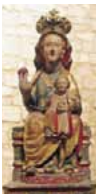
Santuario y Andra Mari de Ntra. Sra. de Okon. (Bernedo)

Okon, datada en los siglos XIII o XIV. Quizás esa imagen sea la que, según la tradición, apareció en un lugar del viejo camino que conduce de Bernedo al Santuario. Hoy recuerda ese hecho una hornacina. Un parque dotado de mesas y bancos, en el que se han instalado una muestra de aperos agrícolas antiguos con carácter etnográfico, rodea el santuario.