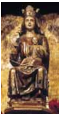
Imagen de Santa María de Oro. Santuario de Oro, sobre las peñas del mismo nombre. (Valle de Zuia)

El lugar aparece documentado por primera vez en el siglo XII. El templo que hoy podemos contemplar es un edificio que se yergue