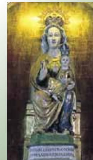
Imagen de Ntra. Sra. de la Asunción, del tipo Andra Mari. (Barajuen)

Con la descripción de estos diecisiete lugares a través de varios posibles itinerarios, se pretende que el viajero tenga una oportunidad de encontrarse con la cultura, la religiosidad y la tranquilidad de Alava de una manera diferente.