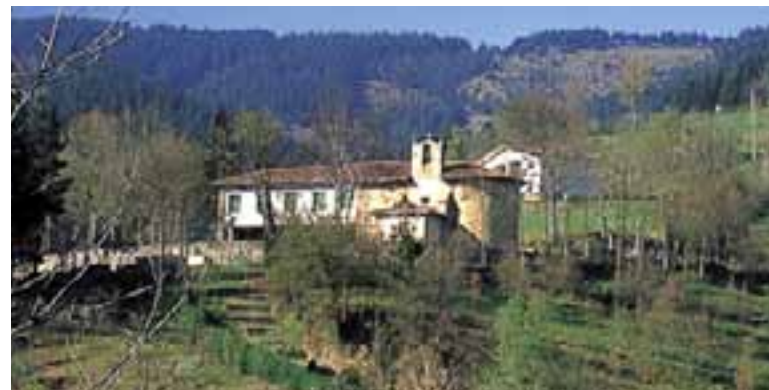
Ermita de Andra Mari de Ibabe. (Ibarra)

Podemos llegar desde Vitoria-Gasteiz por la N-240, con desviación en Legutiano hacia el alto de Cruceta. El entorno del santuario es un paisaje privilegiado. Desde los dos miradores que encontraremos en el camino, se pueden contemplar los lagos y la Llanada desde el primero y el Valle de Aramaio, salpicado de caseríos, desde el segundo.