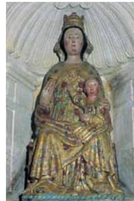
Virgen de La Peña. (Faido)

Este santuario es más interesante por la devoción que le expresan los pueblos de la zona que por su calidad artística. La espadaña de su portada lo diferencia de las viviendas que están adosadas al templo. Este es de planta rectangular y cuenta con un amplio ábside. La imagen de la Virgen es relativamente moderna. La víspera de la Ascensión abandona el santuario para trasladarse