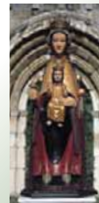
Santuario de Ntra. Sra. de Estíbaliz y Virgen titular. (Argandoña)

El santuario, el monasterio, el centro de acogida, un moderno restaurante y la zona de recreo que la circunda son un singular punto de cita que, además, permite contemplar una magnífica panorámica de la Llanada Alavesa. En el presente siglo ha crecido el auge del santuario. Tanto la cofradía como la Asociación de Amigos de Estíbaliz y gran parte del los alaveses celebran las fiestas de Estíbaliz, que tienen lugar el primer domingo de mayo con la fiesta de la Coronación (el 1 es el Día de los Desagravios); en junio la fiesta de los recorridos; y el segundo domingo de septiembre la fiesta de Oración de Gracias del Patrocinio (el 12 se celebra Santa María de Estíbaliz).